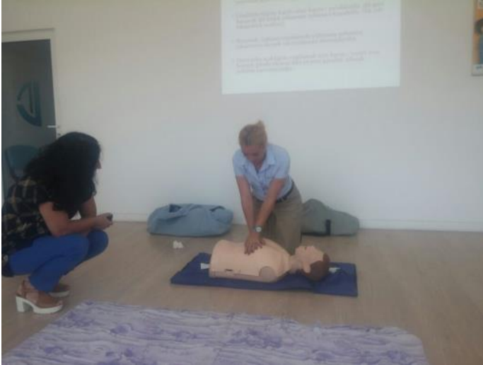
Kalp Masajı / Heart Massage

Çok az sayıda kişi, acil müdahale gerektiren durumlarda neler yapılabileceğini biliyor. Tüm dünyada yaşanan kaza oranı sıklıkları göz önünde bulundurulduğunda, hayat kurtarmaya ya da olası tehlikeleri en aza indirmeye yönelik bu işlemin öneminin geniş kitleler tarafından bilinmesi gerekliliği ortaya çıkıyor. Önceki bültenlerimizde ilkyardım eğitimlerimizin alındığı bilgisini sizlerle paylaşmıştık. Fakat zaman içerisinde edinilen bilginin tazeliğini yitirmemesi adına eğitimlerin yenilenmesi gerektiği aşikardır. Bu nedenle sertifika yenileme amacıyla ilkyardımcı eğitimlerimiz tekrarlanmış, ilkyardımcılarımızın bilgileri tazelenmiştir.