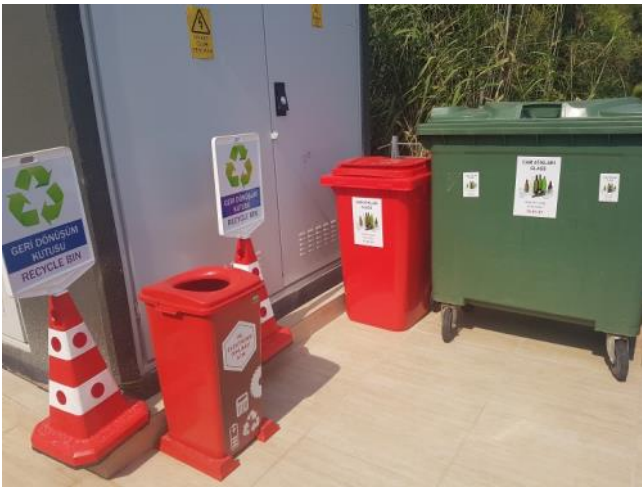
Göcek Village Port iskele girişi Atık Kabul İstasyonu / Waste Disposal Area at Göcek Village Port Marina Entrance

Sizlerin de çevreye olan bilinci ile Çekek sahasında bulunan atık yağ toplama merkezinde toplanan toplam 8 bin litre atık yağ, Çevre ve Şehircilik Bakanlığı, Jandarma Komutanlığı, Gümrük Müdürlüğü, Milli Emlak Müdürlüğü yetkililerinden oluşan komisyon eşliğinde Güllük Limanı'na gönderilmiştir. Komisyonda görev alan tüm kurum personellerine ve sizlere teşekkür ederiz. Teslim edeceğimiz her atık cinsi için Mavi Kart sistemine işletmeniz gerektiğini hatırlatmak isteriz, sorularınız ve atık teslimi ile ilgili Marina ofisimizden yardım alabileceğinizi belirtmek isteriz.