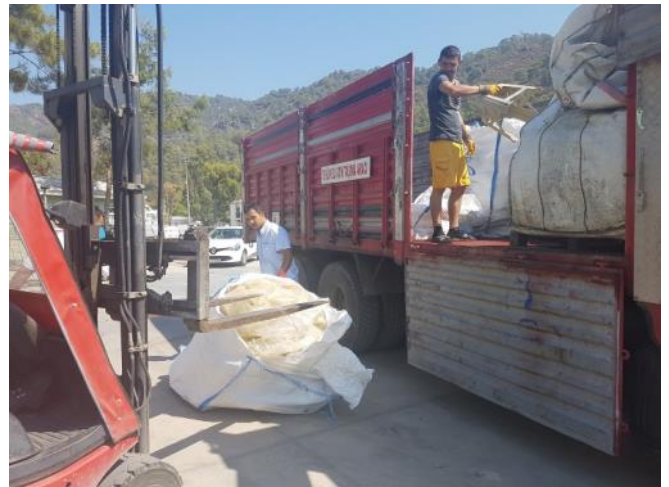
Tehlikeli Atıkların Bertaraf tesisine gönderilmesi / Delivery of Harmful Wastes to be disposed of at Disposal Facility