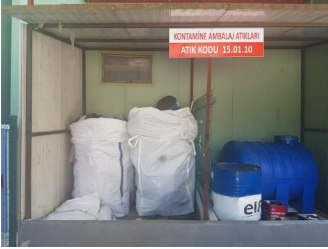
Kontamine Ambalaj Atıkları / Contaminated Boxes

Kullanılan ürünlerin geri dönüştürülerek tekrar kazanımı için Göcek Village Port Marina ve Göcek Exclusive marinada bulunan, cam, metal, plastik, kağıt/karton ve atık pil için ayrılmış olan geri dönüşüm konteynerleri yenilenmiş ve sayıları artırılmış, Göcek Village Port çekek sahasında ise geri dönüşüm konteynerlerine ilave olarak tehlikeli atıklar için de ayrı bir toplama alanı oluşturulmuştur. Zımpara, kontamine olmuş bez, üstübü, fırça, boya kutuları vb. kontamine olmuş atıklar ayrı ayrı toplanmaktadır. Bu sayede geri dönüştürülebilir ürünler tekrar işlenerek hammaddeye dönüşmekte, tehlikeli atıklar anlaşmalı bertaraf tesisine gönderilerek bertaraf ettirilmekte, hem çevrenin korunmasına hem de ekonomiye katkıda bulunmaktadır.