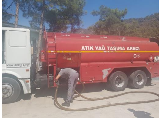
Atık Yağ Teslimatı / Waste Oil Transportation

Sizlerin de çevreye olan bilinci ile Çekek sahasında bulunan atık yağ toplama merkezinde toplanan toplam 8 bin litre atık yağ, Çevre ve Şehircilik Bakanlığı, Jandarma Komutanlığı, Gümrük Müdürlüğü, Milli Emlak Müdürlüğü yetkililerinden oluşan komisyon eşliğinde Güllük Limanı'na gönderilmiştir. Komisyonda görev alan tüm kurum personellerine ve sizlere teşekkür ederiz. Teslim edeceğimiz her atık cinsi için Mavi Kart sistemine işletmeniz gerektiğini hatırlatmak isteriz, sorularınız ve atık teslimi ile ilgili Marina ofisimizden yardım alabileceğinizi belirtmek isteriz.